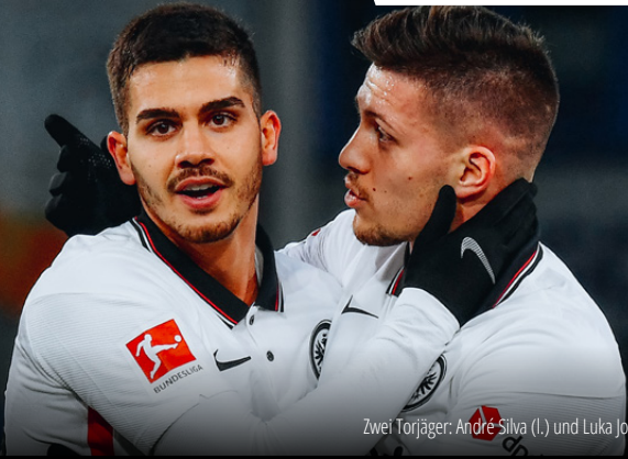
Zwei Torjäger: André Silva (l.) und Luka Jovic.